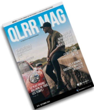
Le MAG QLRR